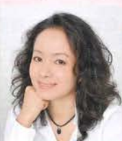
魔法使い ドロロ 金子 あい