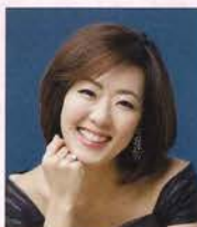
アマー・ビレ姫 (ソプラノ) 三宅 理恵