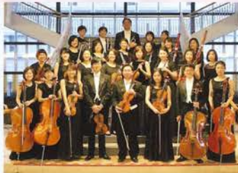
演奏 愛知室内オーケストラ