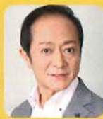
こせき あき ひさ 小関 明久 エテルネル王 おさわが精