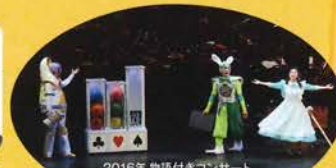
2016年 物語付きコンサート 「アリスのクラシックコンサート」より