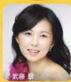
みやたに りか 宮谷 理香 魔法使いドロロ 魔法使いドロロ (ピアノ)