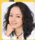
かぬ こ 金子 あい 魔法使いドロロ 魔法使いドロロ (ピアノ)