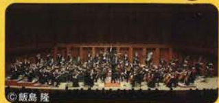
飯島 隆 兵庫県立芸術文化センター管弦楽団 (管弦楽)